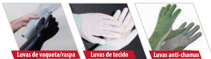
Luvas de vaqueta/raspa

A Orion recomenda usar as luvas isolantes sempre em conjunto com luvas de cobertura para proteção mecânica, que podem ser: